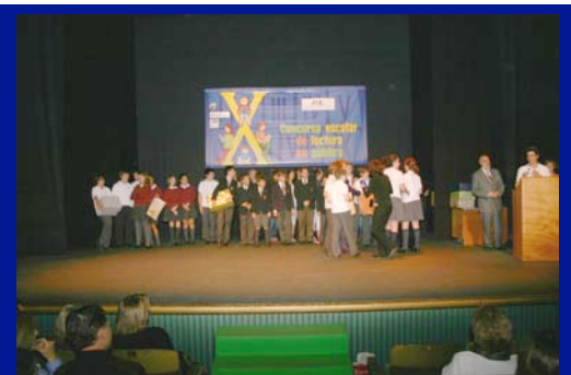
Algunos de los ganadores del X Concurso Escolar de Lectura en Público

18-4-08, Círculo de Bellas Artes de Madrid