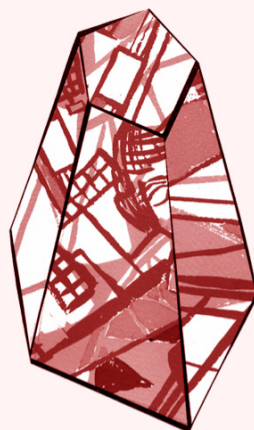
Ilustración de Dinah Salama

Agradecemos cualquier sugerencia sobre este boletín. Si no desea recibirlo, envíenos, por favor, un correo con "Asunto: No Boletín".